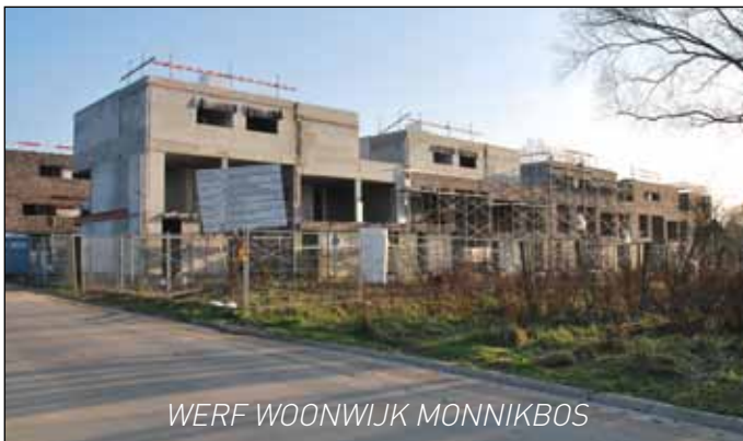
WERF WOONWIJK MONNIKBOS

Liedekerke is klein en dichtbevolkt. Toch krijgen gezinnen – jong en oud – de kans om hier betaalbaar te wonen. Zo worden op dit ogenblik meerdere nieuwe projecten van sociale huisvesting uitgevoerd, met de bouw van huur- en koopwoningen in de wijk Monnikbos (126 wooneenheden), de bouw van 7 koopwoningen en 38 huurappartementen in de Opperstraat . Voorwaarden voor inschrijvingen voor zowel kopers als huurders: website www.volkshuisvesting.be of 02 371 03 30 (huurders), 02 582 41 27 (kopers). Op termijn worden bijkomende sociale bouwgronden en woningen in de wijk Pijnegem voorzien. De eerste bewoners van deze woonprojecten zullen nog dit jaar hun intrek nemen.